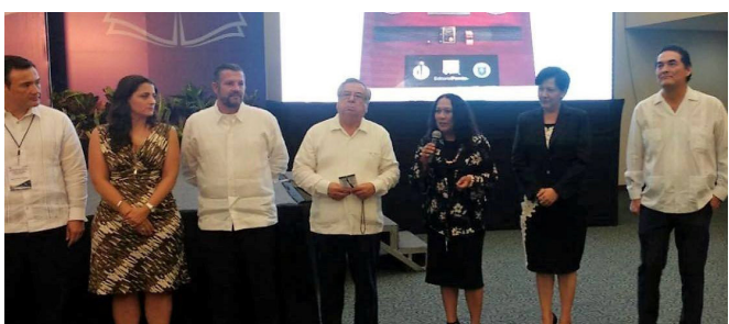
ASISTENCIA AL CONGRESO ELABORACIÓN DE CÓDIGOS DE ÉTICA