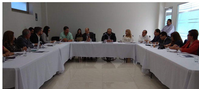
REUNIÓN CON USAID