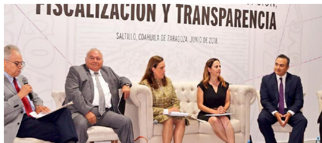
PRIMER SEMINARIO DE VINCULACIÓN DE LOS SISTEMAS NACIONALES ANTICORRUPCIÓN, FISCALIZACIÓN Y TRANSPARENCIA