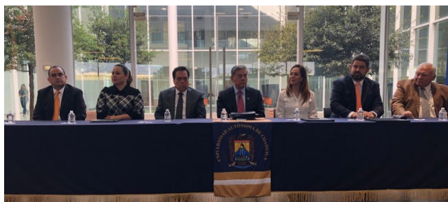
FIRMA DE CARTA COMPROMISO ENTRE LA FEHC Y LA UNIVERSIDAD AUTÓNOMA DE COAHUILA