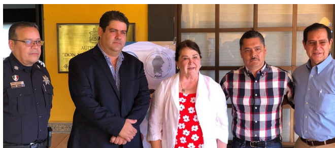
PROGRAMA DE CAPACITACIÓN CONTINUA "PREVENCIÓN DE LA CORRUPCIÓN PARA SERVIDORES PÚBLICOS"