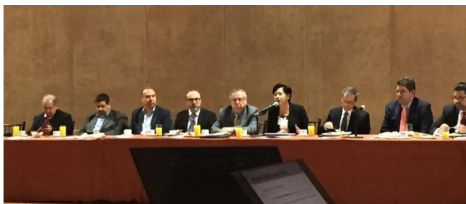
PLÁTICA CON INTEGRANTES DEL CONSEJO COPARMEX REGIÓN SURESTE