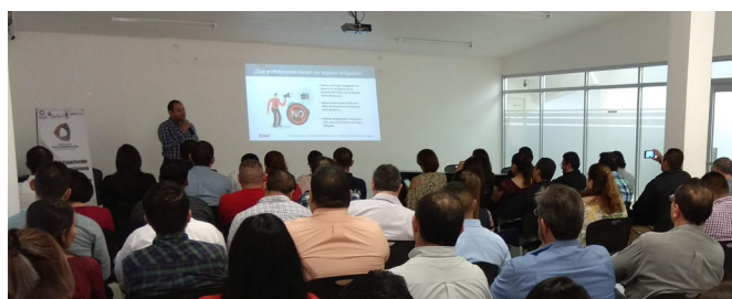
CAPACITACIÓN Y DIFUSIÓN DEL SAEC