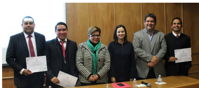
TALLER ANÁLISIS Y RETOS DEL SISTEMA ESTATAL ANTICORRUPCIÓN