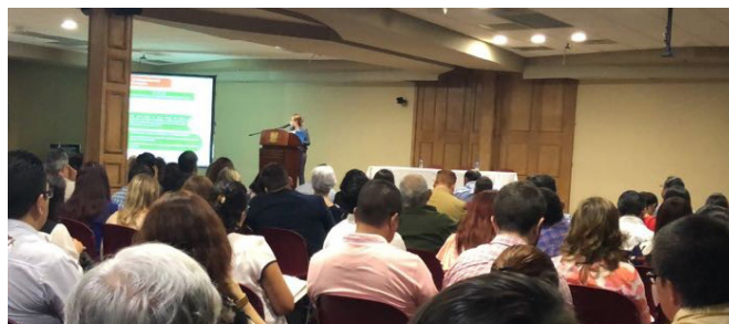
TALLER DE IMPLEMENTACIÓN DEL SISTEMA ESTATAL ANTICORRUPCIÓN